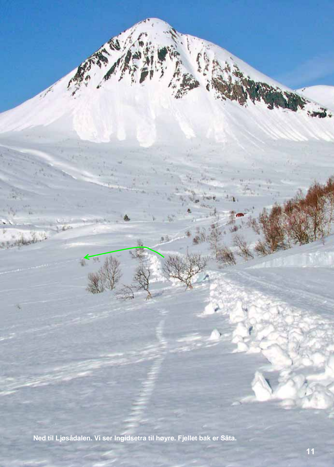
Ned til Ljøsådalen. Vi ser Ingidsetra til høyre. Fjellet bak er Såta.