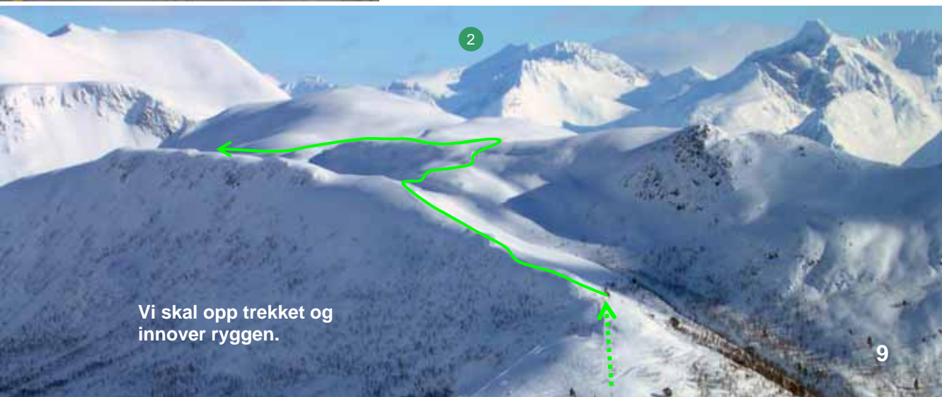
Vi skal opp trekket og innover ryggen.

Gå fra parkeringsplassen over broen til skitrekket. Kjøp enkeltbillett og ta trekket helt til topps (2).