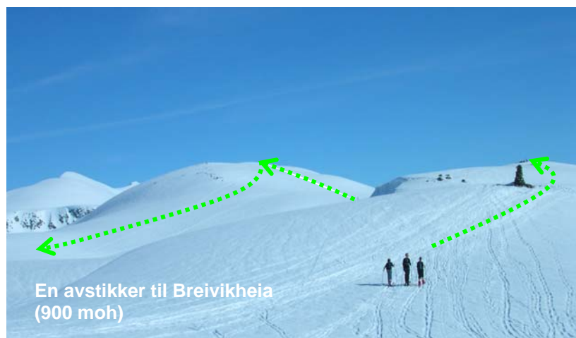
En avstikker til Breivikheia (900 moh)

Vil en forlenge turen tar en av fra løypa på toppen av Strandafjellet og går mot varden som ses på bildet. Forbi denne og et lite stykke ned mot venstre, og så opp på toppen av Breivikheia. Nedkjøring først mot vest (se pila på bildet). Følg deretter den lille dalen ned mot den oppkjørte løypa.