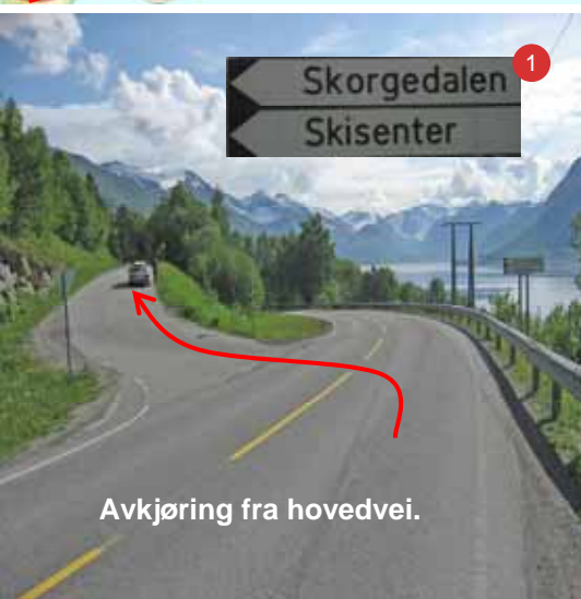
Avkjøring fra hovedvei.