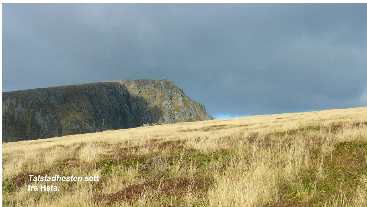
Talstadhesten sett fra Heia.